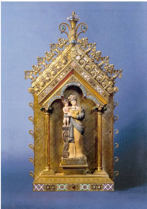
Rechts het beeldje in feesttooi.

Uit de specifieke processies vermelden we nog die van Mützenich, die elke eerste zaterdag komt en terugkeert na de vroegmis op zondagmorgen.